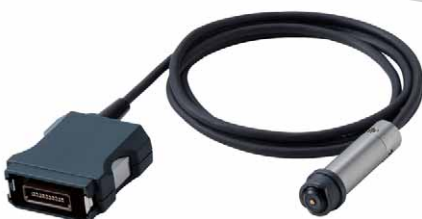
SWT-NEOシリーズ専用プローブ SFN-325